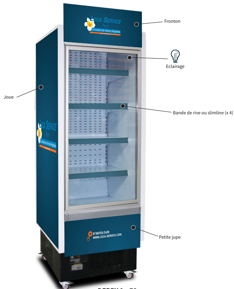
DERBY 0m70 avec porte et PLV

+33(0)3 20 95 52 00 / info@loca-service.com