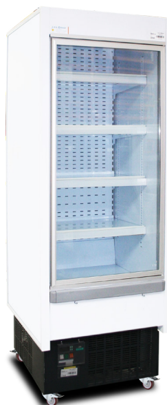
Visuel sans PLV Ref. : DR07L